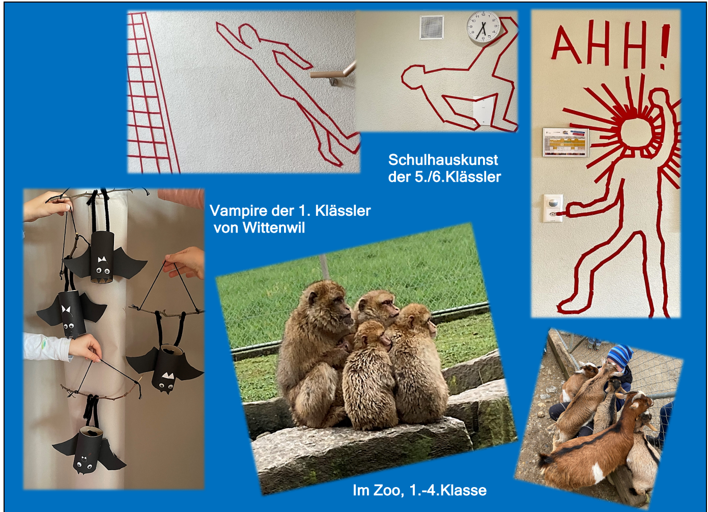
Schulhauskunst der 5./6.Klässler